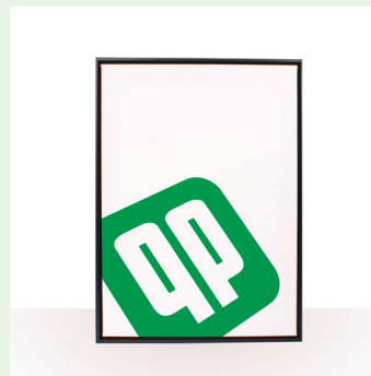
Leinwandbilder auf Keilrahmen mit Schattenfugenrahmen (2 cm Tiefe)