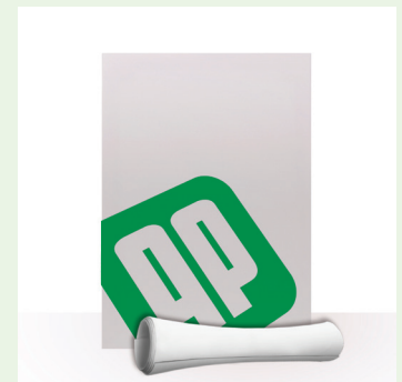
Leinwandbilder ohne Keilrahmen