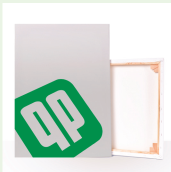
Leinwandbilder auf Keilrahmen Home Edition (2 cm Tiefe) oder Galerie Edition (4 cm Tiefe)