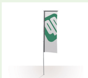
Fahnen für Ausleger