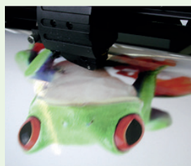
Motiv wird konturgeschnitten