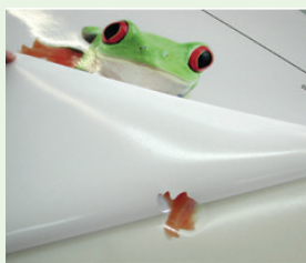
Plot wird ausgehoben