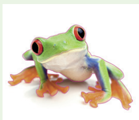
Motiv mit Cut-Kontur