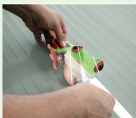
Motiv wird aufgeklebt